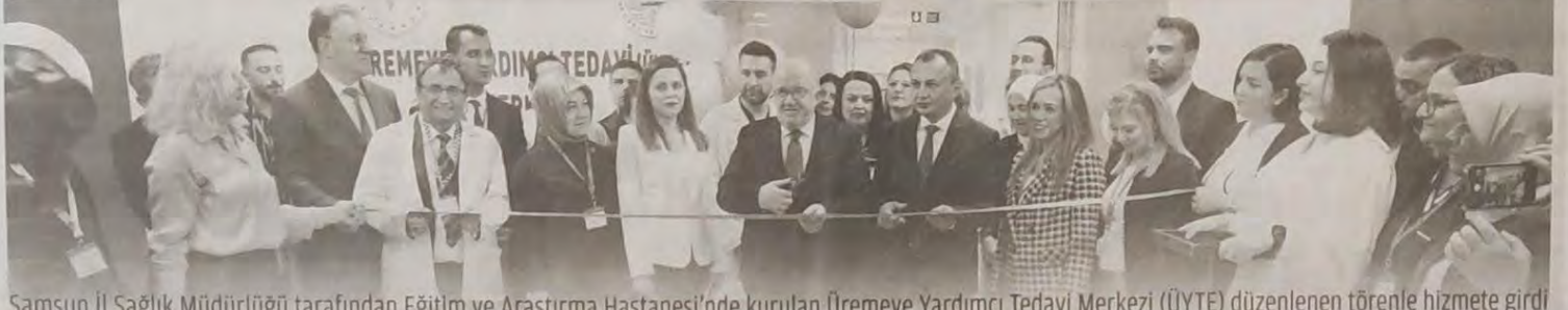
Samsun İl Sağlık Müdürlüğü tarafından Eğitim ve Araştırma Hastanesi'nde kurulan Üremeye Yardımcı Tedavi Merkezi (ÜYTE) düzenlenen törenle hizmete girdi