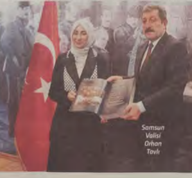
Samsun Valisi Orhan Tavlı

İmzalanan protokol ile birlikte işbirliği yapılan kurumlardaki gönüllü eğitimcilere dezenformasyonla mücadele merkezi uzmanlarıca eğitici eğitimleri verilecek. Bu eğitimleri başan ile tamamlayan gönüllü eğitimciler de eğitim kurumları başta olmak üzere çeşitli kurum ve kuruluşlarda dezenformasyonla mücadele farkındalık eğitimlerini verecek.