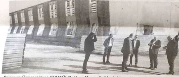
Samsun Üniversitesi (SAMÜ) Balıca Kampüsü'ndeki eski tütün depolarından 3'ünün, kütüphane yapılacağı bildirildi