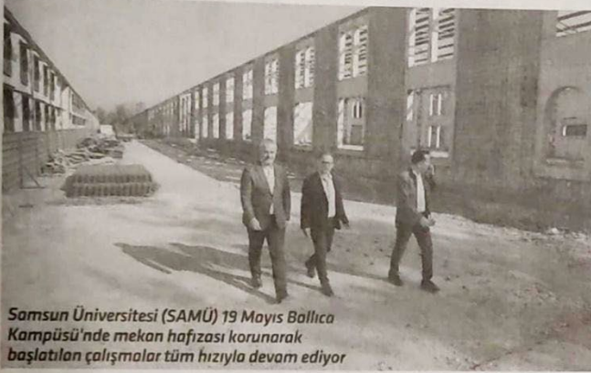
Samsun Üniversitesi (SAMÜ) 19 Mayıs Ballica Kampüsü'nde mekan hafızası korunarak başlatılan çalışmalar tüm hızıyla devam ediyor